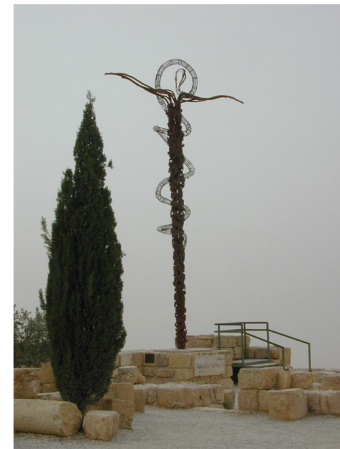
Statue du serpent de bronze de Moïse au Mont Nébo, en Syrie, lieu où l'on situe la mort de Moïse

C'est à chacun et à nous communauté rassemblée que Jésus dit : « Si quelqu'un veut venir à ma suite... » « Veux-tu venir à ma suite ? »