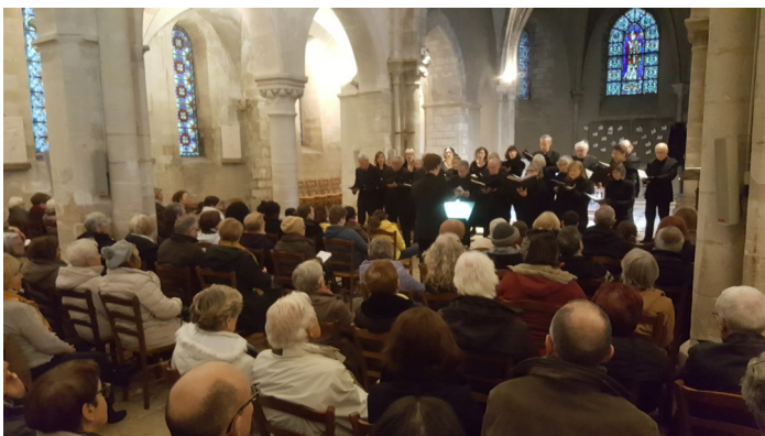
Concert de Noël des « Amis de la musique » 16 décembre 2018