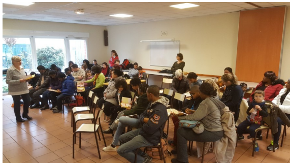
Préparation de la 1ère communion (2/2): Jésus veut s'embarquer dans le cœur des enfants et de leurs familles