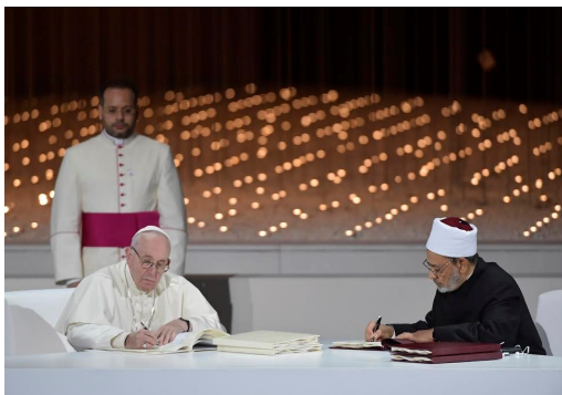
Le Pape François et le Grand Imam d'Al-Azhar Ahmad Al-Tayyeb signant la déclaration d'Abou Dhabi lundi 4 février 2019

Al-Azhar et l'Eglise Catholique demandent que ce Document devienne objet de recherche et de réflexion dans toutes les écoles, dans les universités et dans les instituts d'éducation et de formation, afin de contribuer à créer de nouvelles générations qui portent le bien et la paix et défendent partout le droit des opprimés et des derniers.