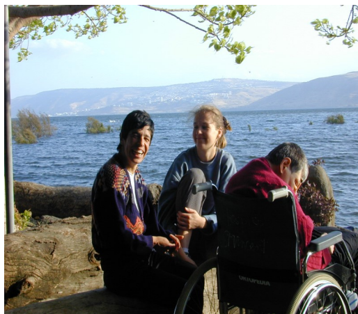
Groupe de personnes handicapées sur le bord du Lac de Tibériade, à Tabga (2004)