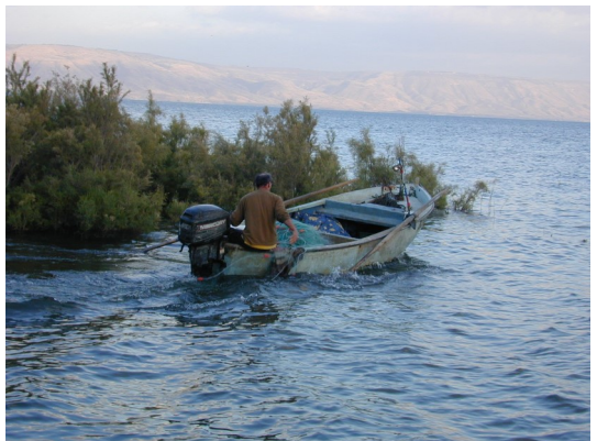
Pêcheur jetant les filets sur le Lac de Tibériade

Et voilà que Jésus a besoin de Pierre, de chacun de nous, pour s'adresser à la foule, qu'il veut s'embarquer en nous, entrer dans nos vies, vies de chacun de nous, barque aussi que nous formons en paroisse, pour que sa