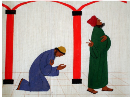
Le Père implorant le fils aîné d'entrer dans la fête

Notre Seigneur est miséricordieux. « Il est tendresse et pitié, lent à la colère et plain d'amour (Ps 103, 8) ». Nous sommes appelés sans cesse à comprendre que l'amour du Père est plus grand que nos péchés et à revenir vers lui pour acquérir la vie éternelle. Qui que nous soyons, quelle que soit notre situation de vie, Dieu nous aime et nous accueille dans sa maison avec des bras ouverts. Comme nous recevons le pardon du Père, nous sommes acceptés, nous sommes aussi invités à pardonner à nos frères et sœurs quand ils retournent. Saint Paul nous invite à travers la deuxième lecture devenir des créatures nouvelles habités par l'Esprit Saint dans le Christ. Habitons dans le Christ, revenons à Dieu et demeurons les ambassadeurs du Christ et les messagers de la paix, de joie et de réconciliation dans le monde.