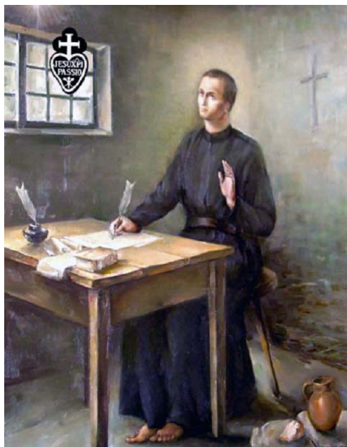
Saint Paul de la Croix écrivant la règle des passionistes

Paul de la Croix s'inscrit dans cette longue liste de témoins de l'Evangile et tout particulièrement de l'Evangile de la Passion de Jésus, qu'il considérait comme « l'œuvre la plus stupéfiante de l'amour de Dieu ». Le milieu qui le voit naître en 1694 n'est pas celui de l'aristocratie mais celui de l'humble peuple des montagnes du nord de l'Italie. A 19 ans, il est bouleversé par la parole de Jésus : « Quitte tout et suis-moi ». Paul accueille cet appel radical et pendant une retraite de 40 jours dans le silence, la prière et la pénitence il écrit la première « Règle de vie » des « Pauvres de Jésus » qui deviendront par la suite les Passionistes. Aussitôt Paul commence à parcourir les régions les plus insalubres d'Ita-