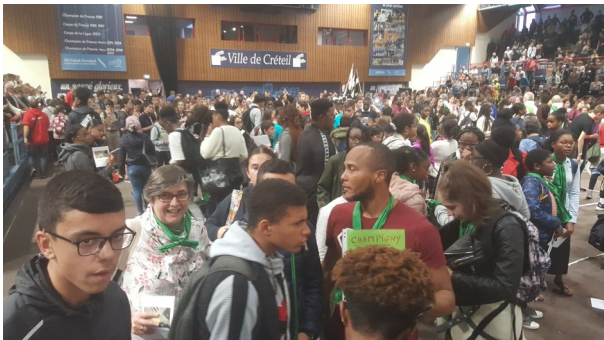
Quelques-uns des participants de Champigny à « Youth festival 94 » dimanche 13 octobre 2019