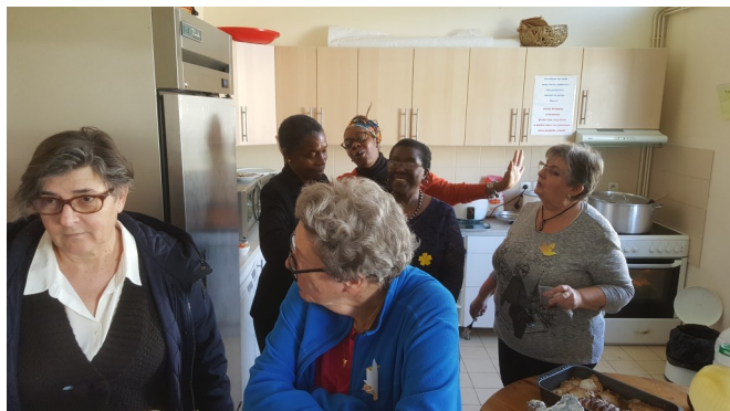
Table Ouverte Paroissiale - Dimanche 10 novembre 2019

Le royaume ne peut être décrit et Jésus multiplie les paraboles pour nous aider à nous ouvrir à cette réalité dont nous ne pouvons pas nous faire une image. « A quoi le comparer ? », demande Jésus... « Il est semblable à... » Et ce sont les paraboles du Semeur, de l'ivraie à ne pas arracher, du grain de moutarde, du levain dans la pâte, du trésor, de la perle, du filet, des ouvriers de la onzième