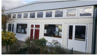
Nouvelles portes de sécurité