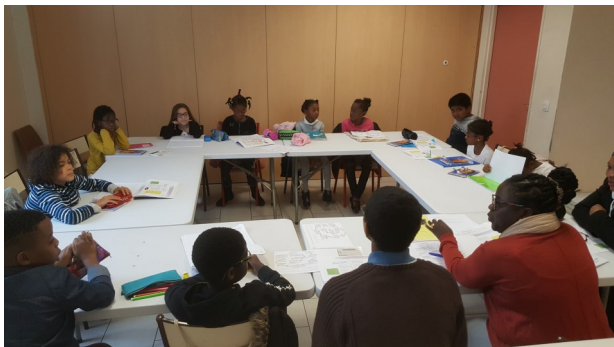
Enfants préparant les chemins du Seigneur en accueillant sa Parole au catéchisme