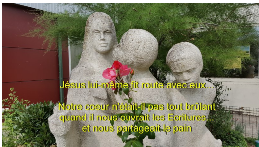
Église Saint Jean XXIII du Bois l'Abbé

Cléophas et son compagnon sont découragés. Ils quittent Jérusalem. Ils