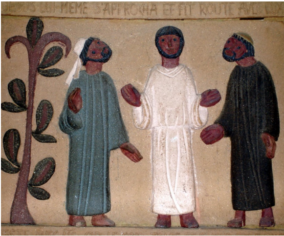
Abbaye bénédictine de La Rochette