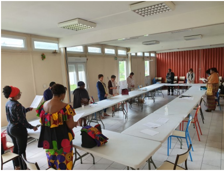
Temps de prière en fin de rencontre