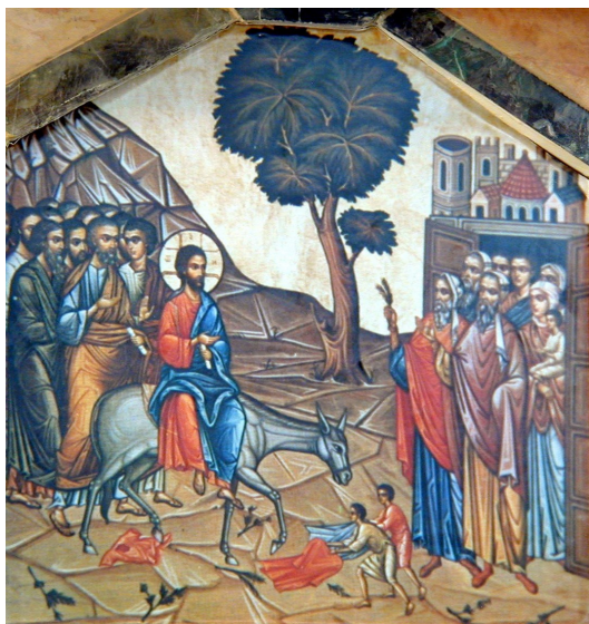
Eglise de Karak, Jourdanie

Nous entendrons Jésus dire : « L'Esprit du Seigneur est sur moi parce que le Seigneur m'a consacré par l'onction. Il m'a envoyé porter la Bonne Nouvelle aux pauvres, annoncer aux captifs leur libération, et aux aveugles qu'ils retrouveront la vue, remettre en liberté les opprimés, annoncer une année favorable accordée par le Seigneur. » « Aujourd'hui, cette