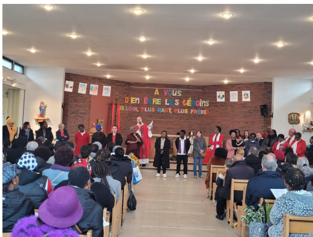
Messe des Rameaux dimanche 24 mars à Jean XXIII Présentation de personnes nommées lors de la 1ère étape de la consultation en vue de l'appel en Equipe d'Animation Paroissiale

Je le dis à chacun de vous en particulier : Le Christ vit et t'aime, infiniment. Et son amour pour toi n'est pas conditionné par tes chutes ou tes erreurs. Lui, qui a donné sa vie pour toi, Il n'attend pas que tu sois parfait pour t'aimer. Regarde ses bras ouverts sur la croix et « laisse-toi sauver encore et encore ». 1 Marche avec Lui comme avec un ami, accueille-le dans ta vie et laisse-le partager les joies et les espé-