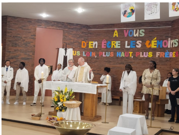
Veillée pascal à Jean XXIII (30/3/2024)

Dans la première lecture de ce jour, nous voyons que la manière de vivre des premiers chrétiens a été transformée par leur foi en Jésus : « La multitude de ceux qui étaient devenus croyants avait un seul cœur et une seule âme ; et personne ne disait que ses biens lui appartenaient en propre, mais ils avaient tout en commun. C'est avec une grande puissance que