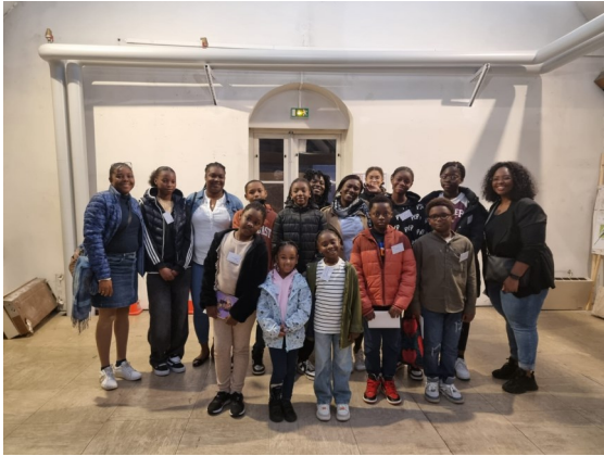
Les enfants ayant participé à « Aventure et prière » et quelques-uns de leurs parents

Il vient « rassembler les élus des quatre coins du monde »